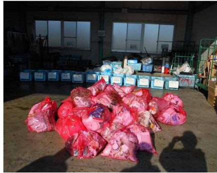
調査する前の風景

平成25年1月24日(木)に二村台1区の燃えるごみの中に、どんなものが入っているかの調査を行いました。結果は裏面のとおりです。