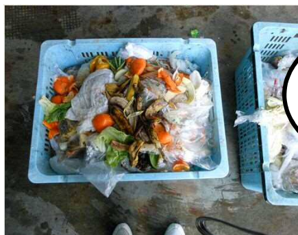
手をつけている生ごみ(全体の22.5%)

使いきれ的分だけ買っていただいたり、使える部分は使い切ってくださいようなエコクッキングを実践していただくことで、かなりのごみの減量になります。