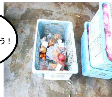
手をつけていない生ごみ(全体の2.8%)

ごみの減量は、焼却施設から出る二酸化炭素や大気汚染物質の量が少なくなる事に加え、ごみの処分にかかるコストも低くなり、ごみの最終処分場の延命も図られます。